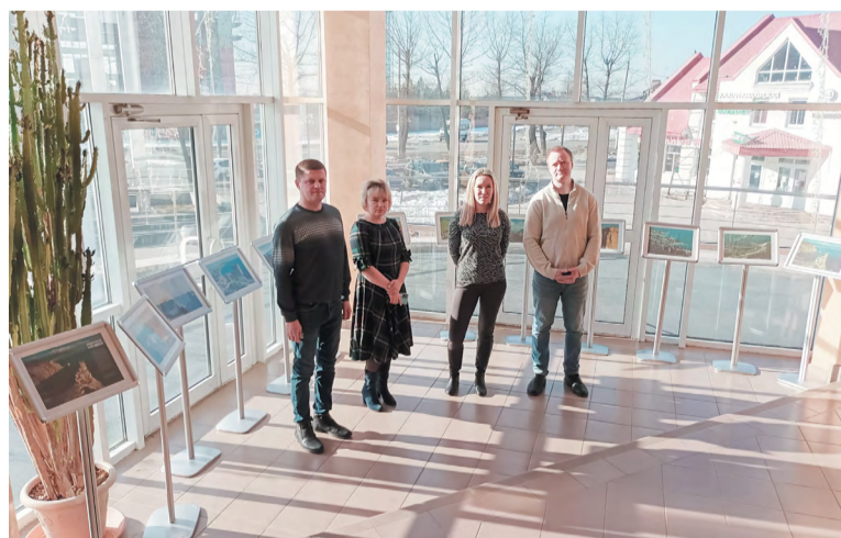
Выставка, посвящённая возвращению Крыма, открылась в СКЦ «Пересвет»

На выставке, которая открылась в СКЦ «Пересвет» представлены работы фотокорреспондентов агентства ТАСС, рассказывающие о впечатляющих результатах пройденного пути, в их числе инфраструктурные объекты, природные заповедники,