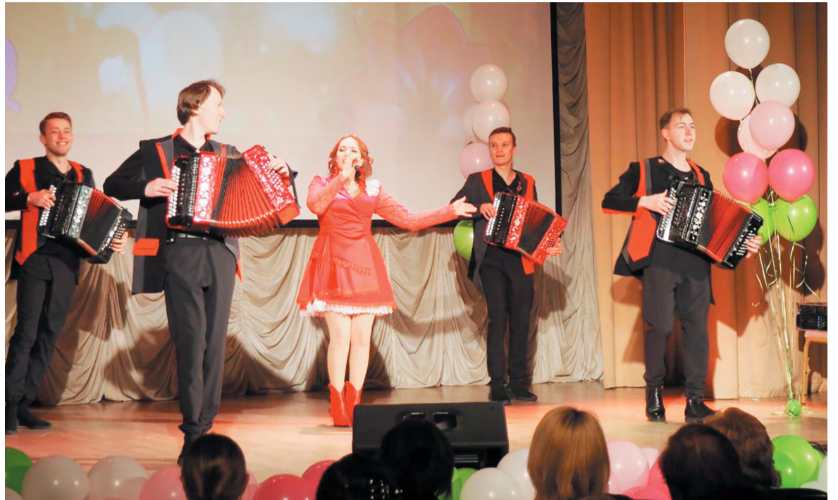
Замечательным подарком к празднику стало выступление ансамбля «Фолк фреш»

«Дорогие наши женщины! В зале сейчас столько цветов, но ни один из них не затмит вашу красоту. Сегодня ваш праздник, вы улыбаетесь, у вас прекрасное настроение, – обратился он к сидящим в зале. – И я больше всего на свете бы хотел, чтобы эти улыбки были на ваших лицах не только в праздник. Что-