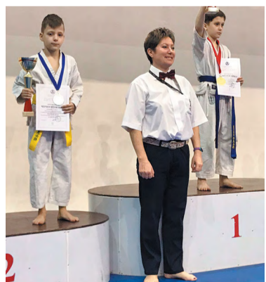
(где пьедестал) Среди «Московских звёзд» по кумитэ и ката есть и звёздочка из нашего поселения

А 6 марта в СК «Десна» прошли первые Окружные соревнования по флорболу, также в рамках Московской межклубной спартакиады «Московский двор – спортивный двор». В них уча-