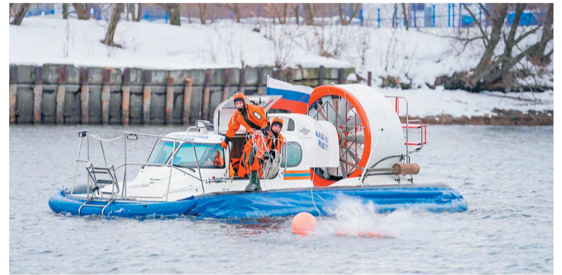
Осторожно! Тонкий лёд

Весной с повышением температуры воздуха лёд теряет прочность, а потому представляет наибольшую опасность, в результате чего увеличивается вероятность провалов. Специалисты Управления Департамента ГОЧСиПБ по ТиНАО напоминают, что лёд всегда таит опасность – беда может произойти из-за детской шалости, во время рыбалки или просто при переходе по льду. Избежать происшествий можно, если соблюдать правила безопасности.