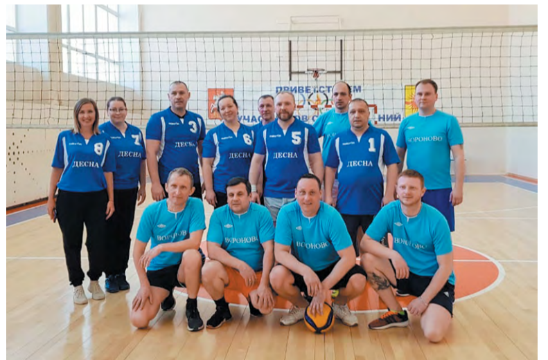
Спортсмены поселения Рязановское победили в очередном туре чемпионата